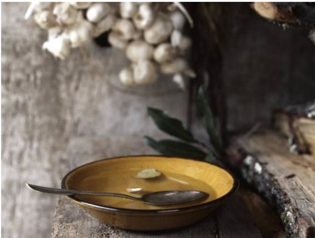
Knoblauch spielt die Hauptrolle in der Zubereitung einer «Aigo boulido».